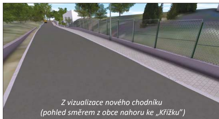
Z vizualizace nového chodníku (pohled směrem z obce nahoru ke „Křížku“)