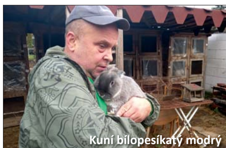
Kuní bílopesíkatý modrý

se musí udělat ty zkoušky a posuzuje se. A posuzovatelé jsou taky sdružení ve zvláštním sboru s předsedou, to je orgán většinou čtyř až pěti lidí. Ti se potom většinou schází při větších výstavách. Já se posuzování věnuji od roku 1999. A posuzuje se podle tady této „útlé knížky“ ( pan Lakomý přináší obří knihu chovatelských standardů ). To je vzorník plemen králíků. Tady najdete všechny druhy králíků, kteří se u nás chovají. Má to všeobecnou a potom hlavně speciální část. A potom se dělá každý rok ještě školení posuzovatelů, tam se ještě proškoluje a případně se probírají stížnosti, když je podají páni chovatelé. To se taky někdy stává.